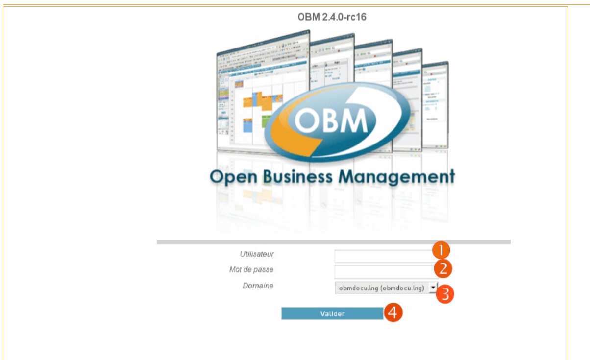
Illustration 1: connexion à OBM