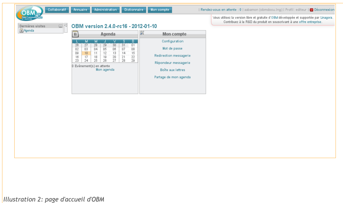
Illustration 2: page d'accueil d'OBM